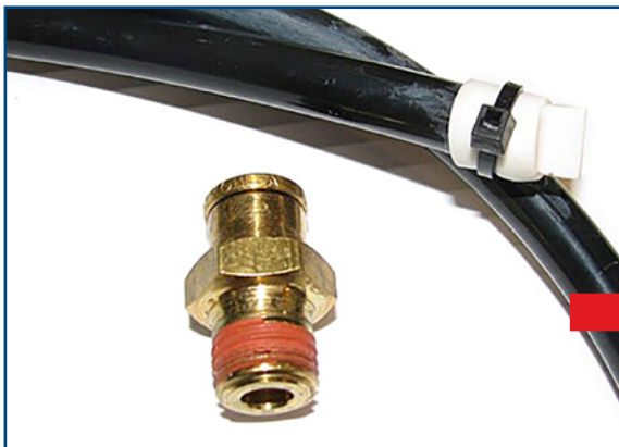
EXISTING VENT ASSEMBLY 2-Piece System

STEMCO is pleased to announce the new dual-duckbill axle vent for STEMCO Aeris Automatic Tire Inflation System. The new vent replaces a 2-piece assembly with a simpler and faster to install single piece that screws directly in the 1/4" NPT hole and eliminates the need for the 3/8" tubing — no changes to the axle are required for installation.